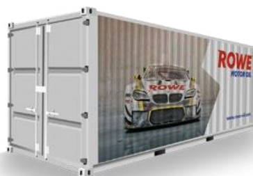
Перевезення у контейнерах / Container Shipments