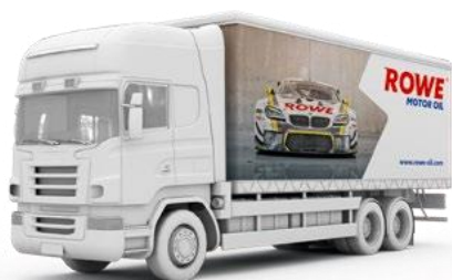
Автомобільні грузові перевезення / Truck Shipments

* Укладаються в 2 шари / Stackable in 2 layers.